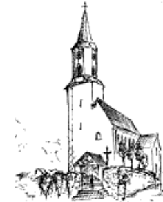
Döfering St. Ägidius 93488 Schönthal Tel. 09978/618