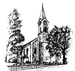
Hiltersried St. Johannes der Täufer Fax 09978/801651