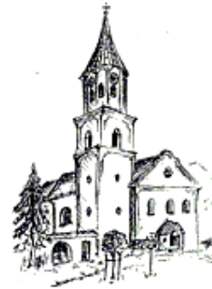
Schönthal St. Michael Alte Chamer Straße 7