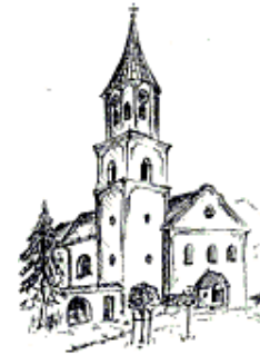
Schönthal St. Michael Alte Chamer Straße 7