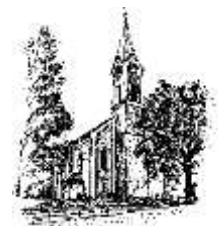
Hiltersried St. Johannes der Täufer

Alte Chamer Straße 7 93488 Schönthal Tel. 09978/618 Fax 09978/801651 e-mail – Adresse schoenthal@bistum-regensburg.de