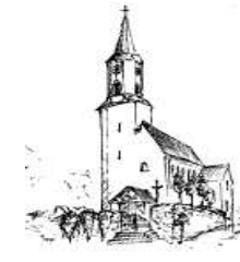
Döfering St. Ägidius