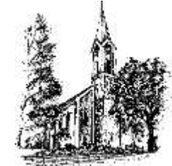
Hiltersried St. Johannes der Täufer Fax 09978/801651

e-mail – Adresse schoenthal@bistum-regensburg.de