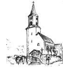
Döfering St. Ägidius 93488 Schönthal Tel. 09978/618