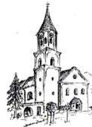
Schönthal St. Michael Alte Chamer Straße 7