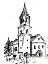
Schönthal St. Michael