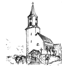
Döfering St. Ägidius Tel. 09978/618