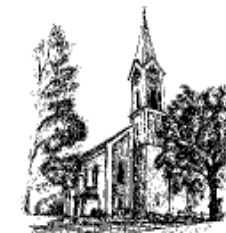
Hiltersried St. Johannes der Täufer Fax 09978/801651

e-mail – Adresse schoenthal@bistum-regensburg.de