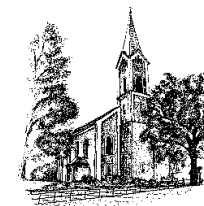
Hiltersried St. Johannes der Täufer