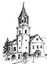
Schönthal St. Michael