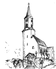
Döfering St. Ägidius