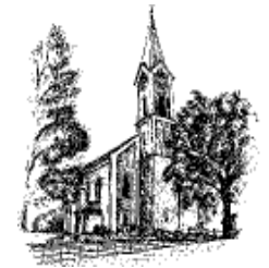
Hiltersried St. Johannes der Täufer Tel. 09978/618 Fax 09978/801651 e-mail – Adresse schoenthal@bistum-regensburg.de