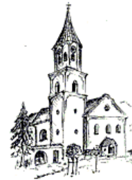
Schönthal St. Michael Alte Chamer Straße 7