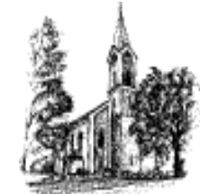
Schönthal St. Michael