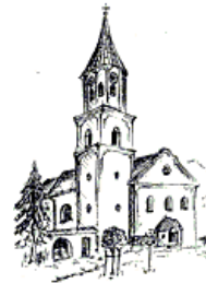
Schönthal St. Michael Alte Chamer Straße 7 e-mail – Adresse schoenthal@bistum-regensburg.de