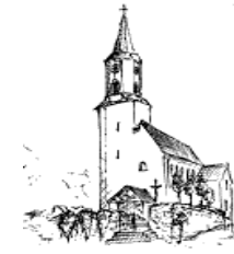
Döfering St. Ägidius 93488 Schönthal e-mail – Adresse schoenthal@bistum-regensburg.de