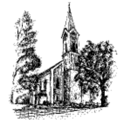
Hiltersried St. Johannes der Täufer Tel. 09978/618 Fax 09978/801651 e-mail – Adresse schoenthal@bistum-regensburg.de