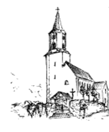
Döfering St. Ägidius 93488 Schönthal