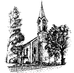
Hiltersried St. Johannes der Täufer Tel. 09978/618 Fax 09978/801651 e-mail – Adresse schoenthal@bistum-regensburg.de