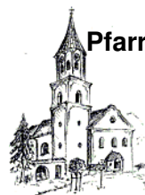
Schönthal St. Michael