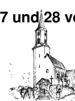
Döfering St. Ägidius