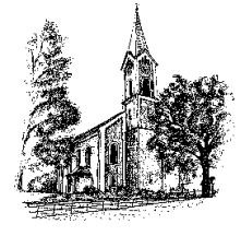
Hiltersried St. Johannes der Täufer Tel. 09978/618 Fax 09978/801651